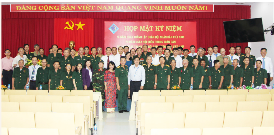
Các đại biểu chụp ảnh lưu niệm.

thể hiện sự phấn đấu không ngừng của Hội viên Hội CCB Trường trong việc phát huy truyền thống tốt đẹp của Bộ đội Cụ Hồ trong nhiệm vụ mới, luôn đồng hành và hỗ trợ tích cực các hoạt động của CCB, Đảng ủy và Ban Giám hiệu Nhà trường nhằm giáo dục truyền thống cách mạng, tạo dựng nền tảng vững chắc trong tư tưởng, cách nghĩ hiện đại về người lính. Nhân lễ kỷ niệm, Hội CCB Trường kêu gọi toàn thể CCB, công chức, viên chức, người lao động và sinh viên toàn trường tích cực hưởng ứng các phong trào giữ gìn an ninh quốc phòng, vững vàng tư tưởng chính trị, đồng thời, không ngừng nỗ lực học tập vươn tới mục tiêu phát triển toàn diện, bền vững và hợp tác quốc tế trong thời đại mới để xây dựng và phát triển Nhà trường ngày càng vững mạnh.