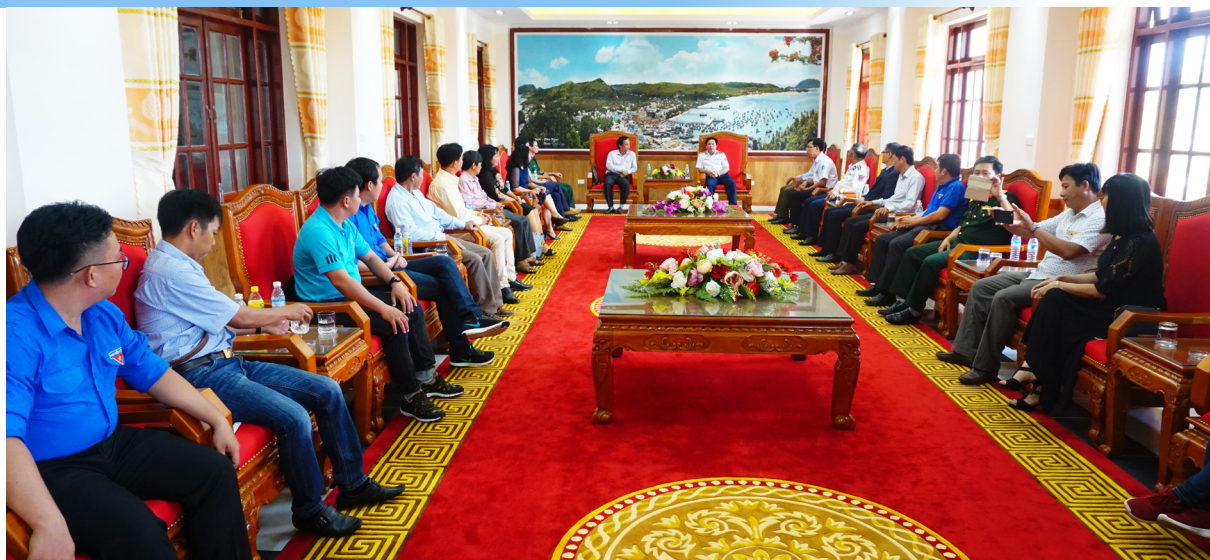
Buổi gặp mặt giữa Đoàn công tác Trường ĐHCT với Bộ Tư lệnh Vùng Cảnh sát biển 4.