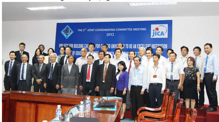
Ảnh lưu niệm sau phiên họp.