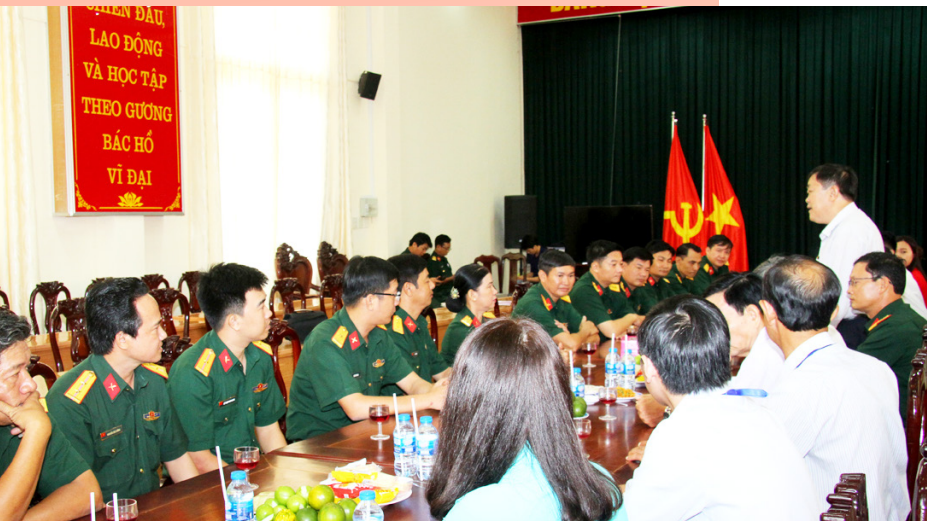
Thăm hỏi và chúc mừng Cục Chính trị Quân khu 9.

nghĩa giữa Nhà trường và Bộ Tư lệnh Hải quân Vùng 5, Bộ Tư lệnh Vùng Cảnh sát biển 4. Sự phối hợp chặt chẽ và giao lưu, trao đổi thường xuyên này đã giúp Nhà trường thực hiện tốt nhiệm vụ chuyên môn, đồng thời nâng cao hiệu quả trong công tác giáo dục lý tưởng, truyền thống và quốc phòng an ninh cho học sinh, sinh viên Trường ĐHCT.