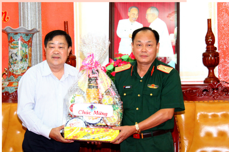
Thăm hỏi và chúc mừng Bộ Tư lệnh Quân khu 9.