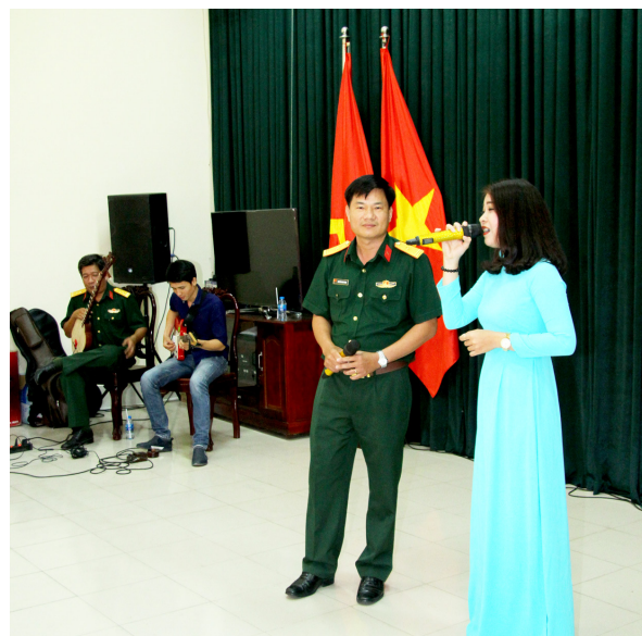
Giao lưu văn nghệ giữa Trường ĐHCT với Cục Chính trị Quân khu 9.

chức và sinh viên Trường ĐHCT đã đóng góp nhiều công sức cho trong việc hỗ trợ, xây dựng và phát triển lực lượng vũ trang nhân dân ngày càng lớn mạnh trong thời gian qua.