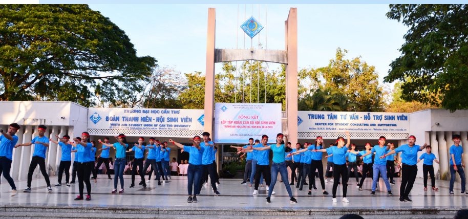
Tiết mục trình diễn dân vũ - kiểm tra cuối khóa.

kiến thức và kỹ năng, hỗ trợ cho trong quá trình công tác cũng như phát triển tổ chức Hội Sinh viên Trường ĐHCT ngày càng vững mạnh. Hy vọng rằng các học viên sẽ mang những nguồn sáng mới đầy sáng tạo và năng động đến với sinh viên, đến với tuổi trẻ ĐHCT, để phong trào sinh viên Trường phát triển trên một tầm cao mới.