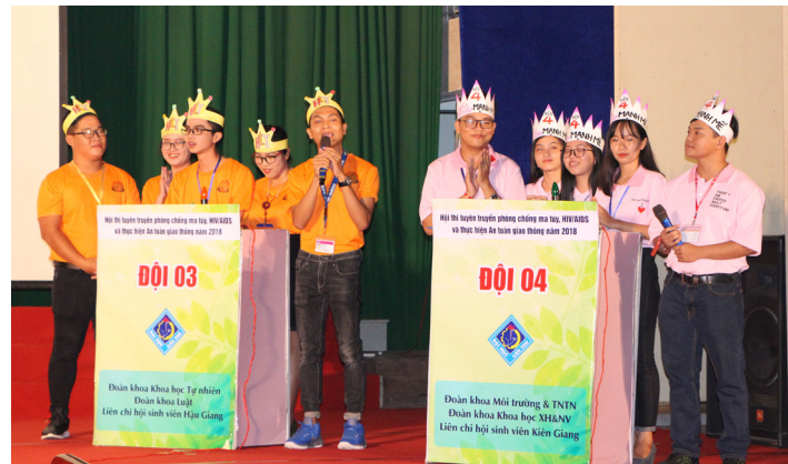
Các đội thi trả lời câu hỏi trắc nghiệm và tự luận ở phần thi thứ nhất.

Bốn đội xuất sắc vào đêm chung kết, xếp hạng phải trải qua ba phần thi: phần thi kiến