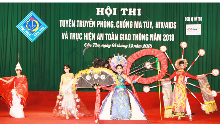
Phần thi thời trang tự chế của Đội 3.

thức, phần thi thời trang tự chế và phần thi xử lý tình huống. Khác với Hội thi của các năm trước, trong phần thi kiến thức lần này các đội phải trải qua 15 câu hỏi, trong đó có 10 câu trắc nghiệm và 05 câu tự luận. Ở các câu hỏi trắc nghiệm, các đội trả lời bằng cách giơ bảng đáp án, còn đối với các câu hỏi tự luận, các đội nhấn chuông giành quyền trả lời trực tiếp.