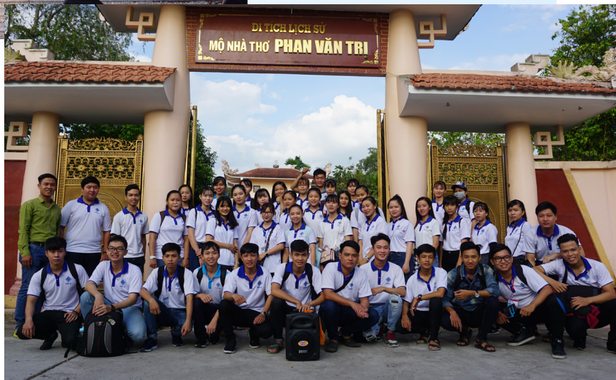
Học viên tham quan các di tích lịch sử tại thành phố Cần Thơ.