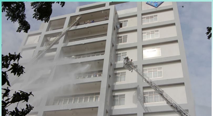
Nâng xe thang cứu những người bị nạn.

Tình huống giả định cháy xảy ra lúc 14 giờ tại Hội trường Ban Giám hiệu (lầu 1). Chất cháy chủ yếu là: bàn ghế gỗ, nhựa tổng hợp, thiết bị điện,... Nguyên nhân xảy ra cháy là do sự cố chập điện, trong cơ sở có nhiều chất dễ bắt