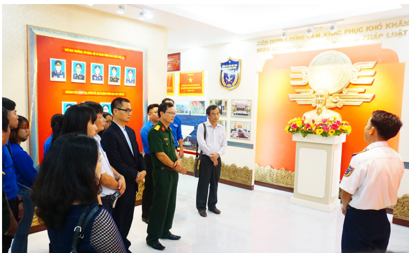
Thăm phòng truyền thống Bộ Tư lệnh Vùng Cảnh sát biển 4.